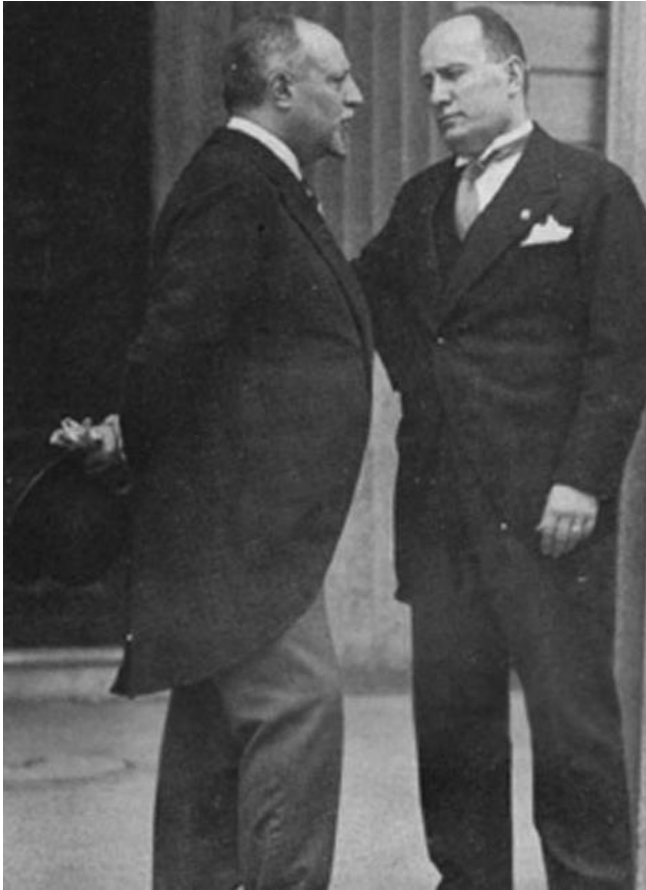
Volpi e Mussolini