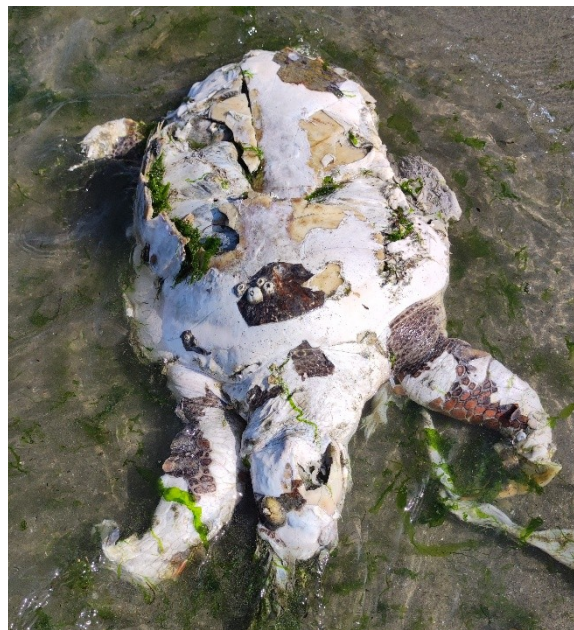
Img. 5: Carcasse sull'Isola dei Gabbiani

Dal momento che le mie ricerche per quest'anno sono state in parte vane, non essendo riuscito a trovare delle ipotetiche nidificazioni, per la spiegazione delle prossime due attività parlerò al condizionale, illustrando cosa avrei dovuto fare. Supponendo dunque di assistere all'atto della nidificazione, le azioni da fare sarebbero state le seguenti: mantenersi innanzitutto a distanza e in silenzio per minimizzare il disturbo dell'animale, chiamare poi gli organi preposti della zona, nel mio caso i contatti con il team del CERT o la guardia costiera (1530), attendere che la tartaruga prenda il largo e procedere con le misure preliminari quali: