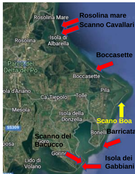
Img. 1: Litorali Parco Delta del Po.

L'elaborato si pone come obiettivo quello di studiare la presenza della tartaruga marina, appartenente alla specie Caretta caretta , nelle coste occidentali dell'alto Adriatico. Più precisamente le ricerche sono state svolte in diversi litorali compresi tra Rosolina mare e l'isola dei Gabbiani, procedendo da Nord verso Sud sulla carta (Img. 1).