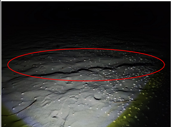
Img. 4: Prove durata solchi.

Il materiale nello zaino era vario in prevenzione alle diverse situazioni che avrei potuto incontrare: con me portavo dunque un metro, un paio di torce, pettorina catarifrangente, dei sacchi, guanti, penna e fogli per eventuali appunti. Nel caso di ritrovamento di una carcassa (Img. 5) il mio primo compito era quella di tracciare la posizione tramite rilevamento GPS, trascinare l'animale ad una buona distanza dal mare per evitarne la perdita a causa di variazioni tidali, il tutto con l'ausilio di guanti per prevenire eventuali infezioni batteriche, coprirlo con teli di fortuna, segnalarne la presenza con dei bastoni e attendere l'arrivo del preposto del CERT. Solo a questo punto la carcassa veniva messa all'interno di sacchi neri i quali, una volta