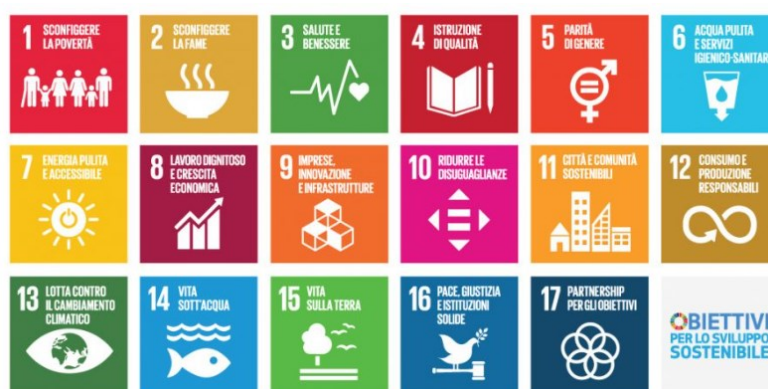
Figura 1.1.1, Obiettivi dell’Agenda 2030.

Ma perché menzionarla in questa tematica? L’azienda 2030 è direttamente collegata ai rating ESG, in quanto i suoi obiettivi forniscono un importante quadro di riferimento per valutare la sostenibilità di un’azienda. Essi forniscono la base per identificare gli impatti positivi e negativi delle attività commerciali sulla società e sull’ambiente.