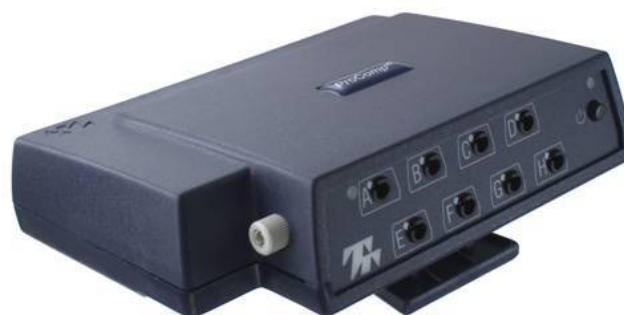
Figura 1: Encoder ProComp