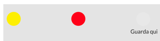
Figura 4: condizione anti-saccadi