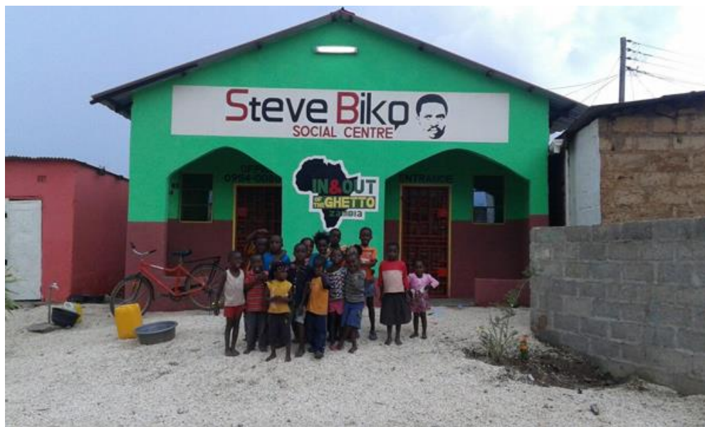
Figura 2: Steve Biko Social Centre, sede di In&Out of the Ghetto. Immagine presa dal sito www.inandoutoftheghetto.org