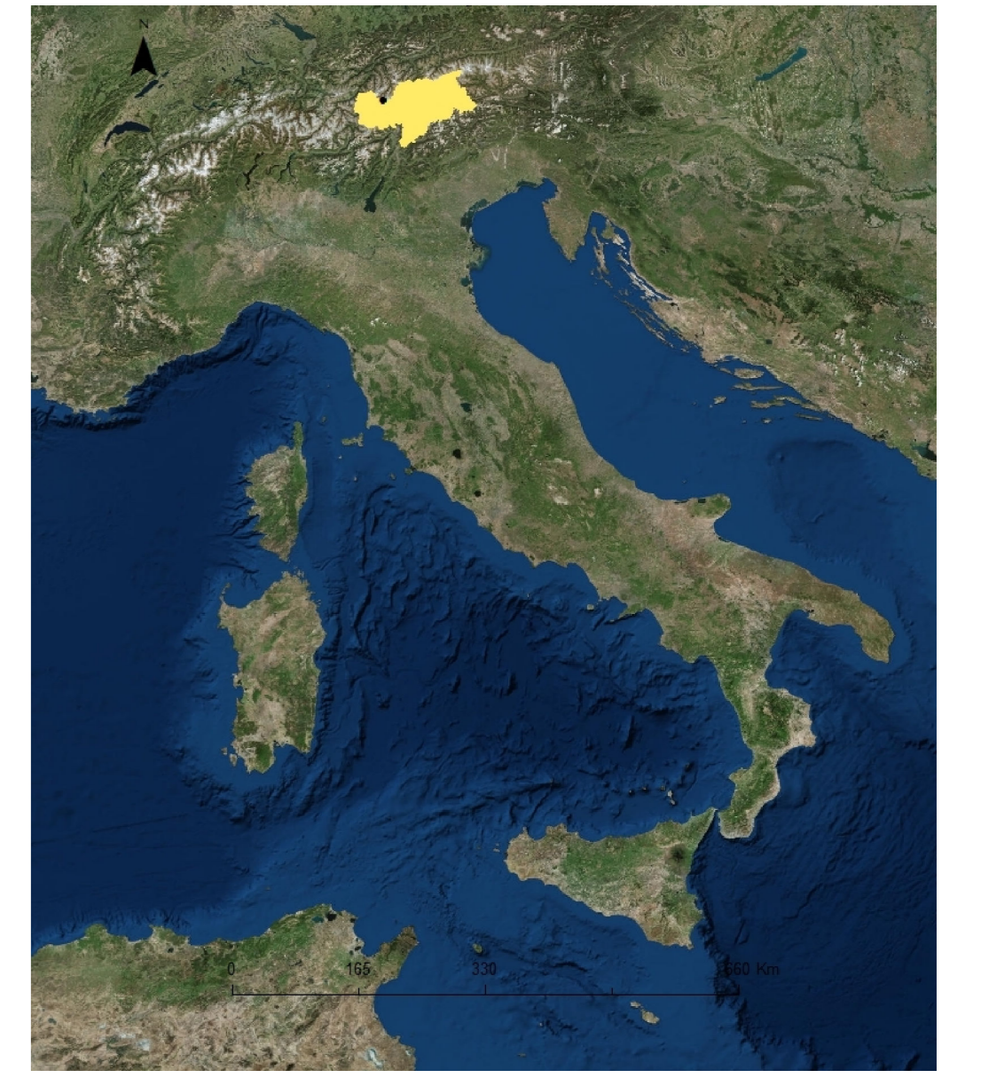
Ubicazione Ghiacciaio della Grava