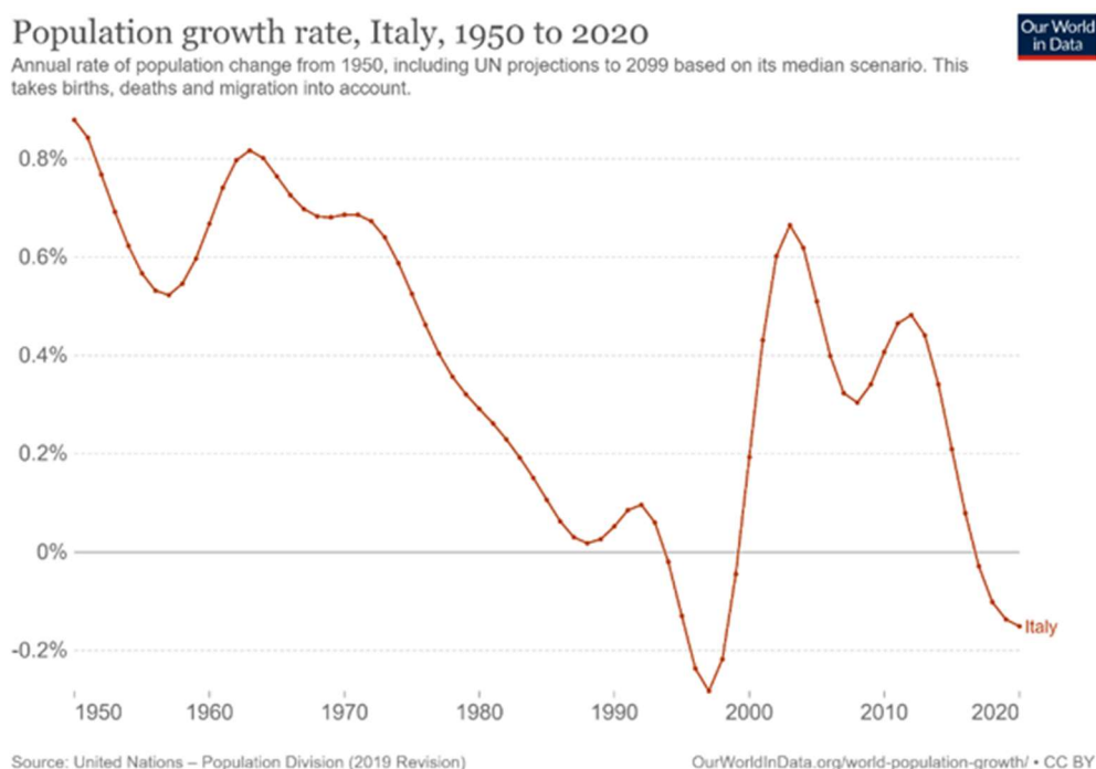
Figura 1: andamento del tasso di fecondità 8 in Italia dal 1950 al 2020

Negli anni '50, l'Italia ha vissuto il fenomeno del baby boom 9 , un aumento significativo delle nascite fino al 1964. Nei due decenni successivi, si è verificato un forte calo (baby bust), con una ripresa modesta tra il 1996 e il 2008, grazie alla maternità rimandata nei decenni precedenti. Tuttavia, dopo