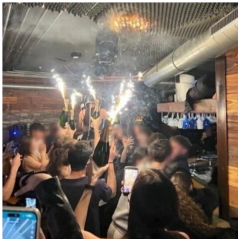
Figura 1.3: Foto dell'incendio dei pannelli fonoassorbenti causato dalle candele pirotecniche

La presenza di schiume e rivestimenti combustibili ha favorito una propagazione estremamente rapida dell'incendio lungo il soffitto, con intenso sviluppo di fumi caldi e gas tossici in ambiente confinato. L'accumulo di gas caldi ha determinato un rapido aumento dell'irraggiamento termico verso le superfici combustibili, fino al raggiungimento della combustione generalizzata dell'ambiente, fenomeno noto come flashover. Nella fase di crescita dell'incendio il tempo utile per l'evacuazione si riduce progressivamente; con il sopraggiungere del flashover le condizioni interne diventano rapidamente incompatibili con la permanenza umana.