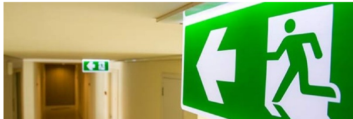
Figura 3.2: Segnaletica di sicurezza

La segnaletica e i sistemi di comunicazione costituiscono quindi componenti integranti del sistema di safety, in quanto contribuiscono a guidare il comportamento del pubblico e a supportare l'efficacia delle misure strutturali e organizzative adottate.