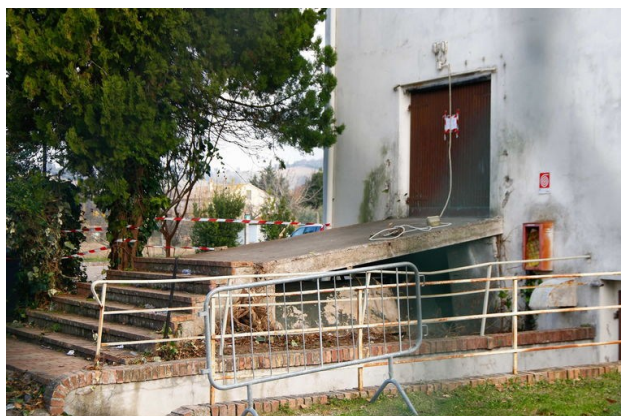
Figura 1.2: Foto della rampa in cui è avvenuto il crollo del parapetto

Le indagini giudiziarie hanno accertato responsabilità sia nei confronti dei soggetti che avevano utilizzato lo spray urticante – facenti parte di un gruppo che utilizzava spray al peperoncino per commettere furti durante eventi affollati – sia nei confronti dei gestori del locale e degli organizzatori dell'evento, in relazione al superamento della capienza autorizzata, alle carenze nel controllo degli accessi e alle difformità strutturali dell'uscita interessata dalla dinamica letale.