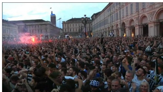
Figura 1.1: Foto di Piazza San Carlo durante la partita Real Madrid – Juventus

Dal punto di vista tecnico, la dinamica che si sviluppò fu quella di una compressione della folla (crowd crush) generata dall'elevata densità presente e dall'improvviso movimento simultaneo verso i varchi di uscita. La pressione progressiva esercitata dalla massa delle persone determinò cadute a catena e situazioni di schiacciamento, in particolare in prossimità delle transenne e degli accessi al parcheggio sotterraneo, dove si verificarono improvvise concentrazioni della folla. Il bilancio fu di circa 1.600 feriti e, nei mesi successivi, di tre decessi riconducibili alle conseguenze delle lesioni riportate. Le principali cause dei danni furono traumi da caduta e lesioni da compressione, più che effetti diretti dello spray stesso.