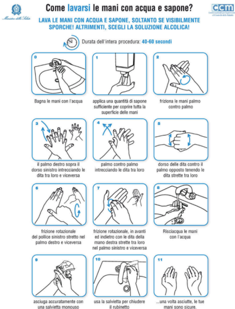
Figura 7 – Ministero della Salute

Per garantire la pulizia e l'igiene necessaria è essenziale seguire lo schema di indicazione dell'opuscolo rilasciato dall'Organizzazione Mondiale per la Sanità.