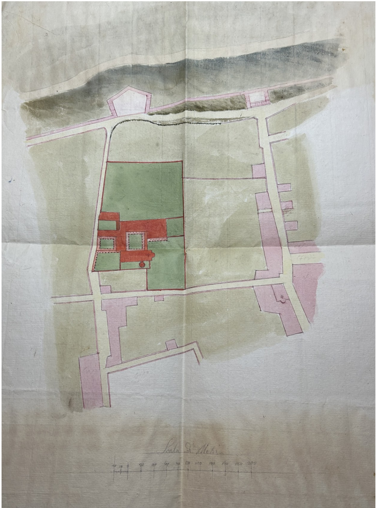
Figura 2. Il progetto di ampliamento del cimitero di San Bernardino visto in relazione al quartiere.