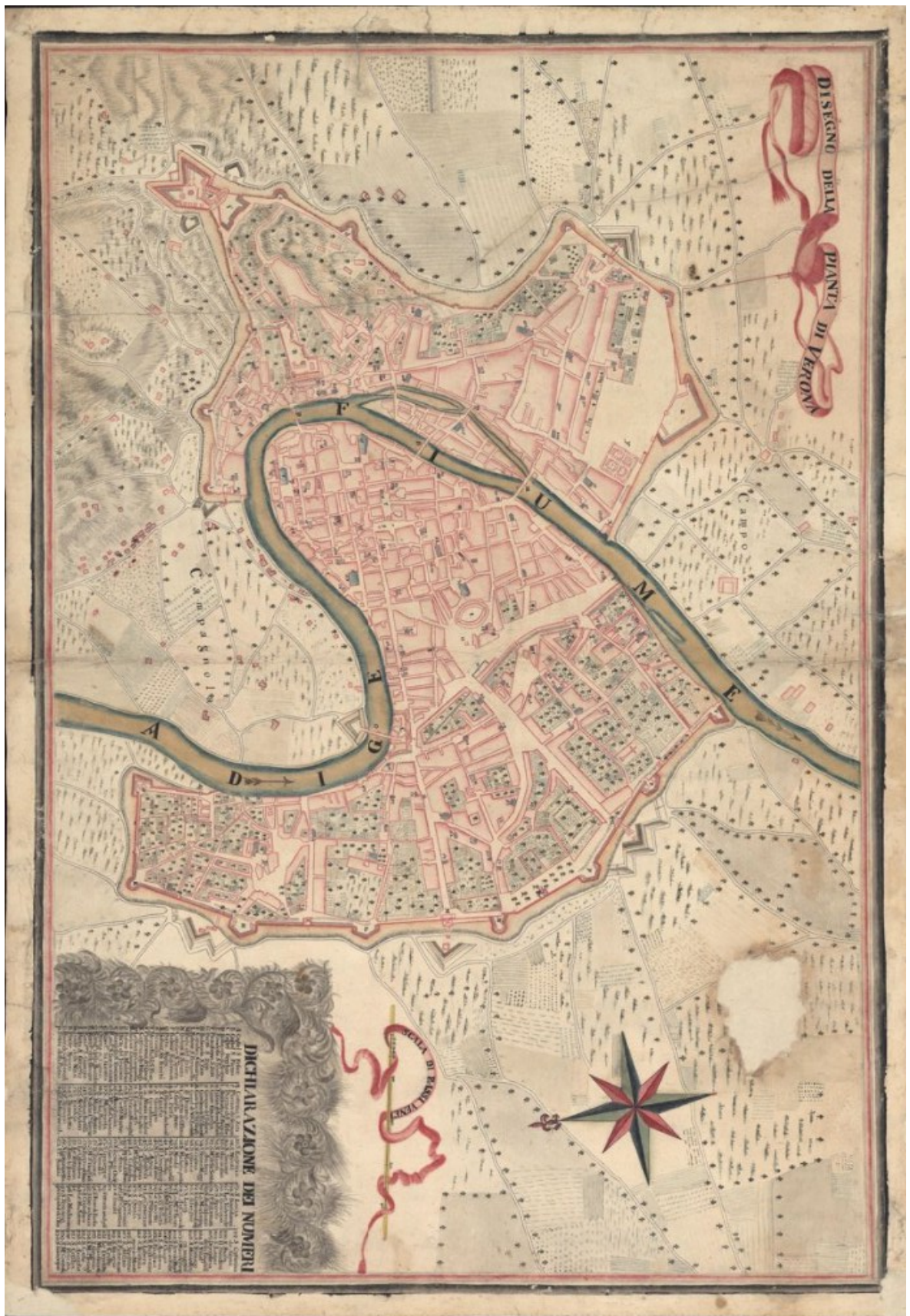
Figura 1. "Pianta della città di Verona rilevata per pubblico Comando (1737)". Archivio Digitale dell'Archivio di Verona. Accesso 08/01/2026.

https://archiviodigitale-icar.cultura.gov.it/it/185/ricerca/detail/2780209 .