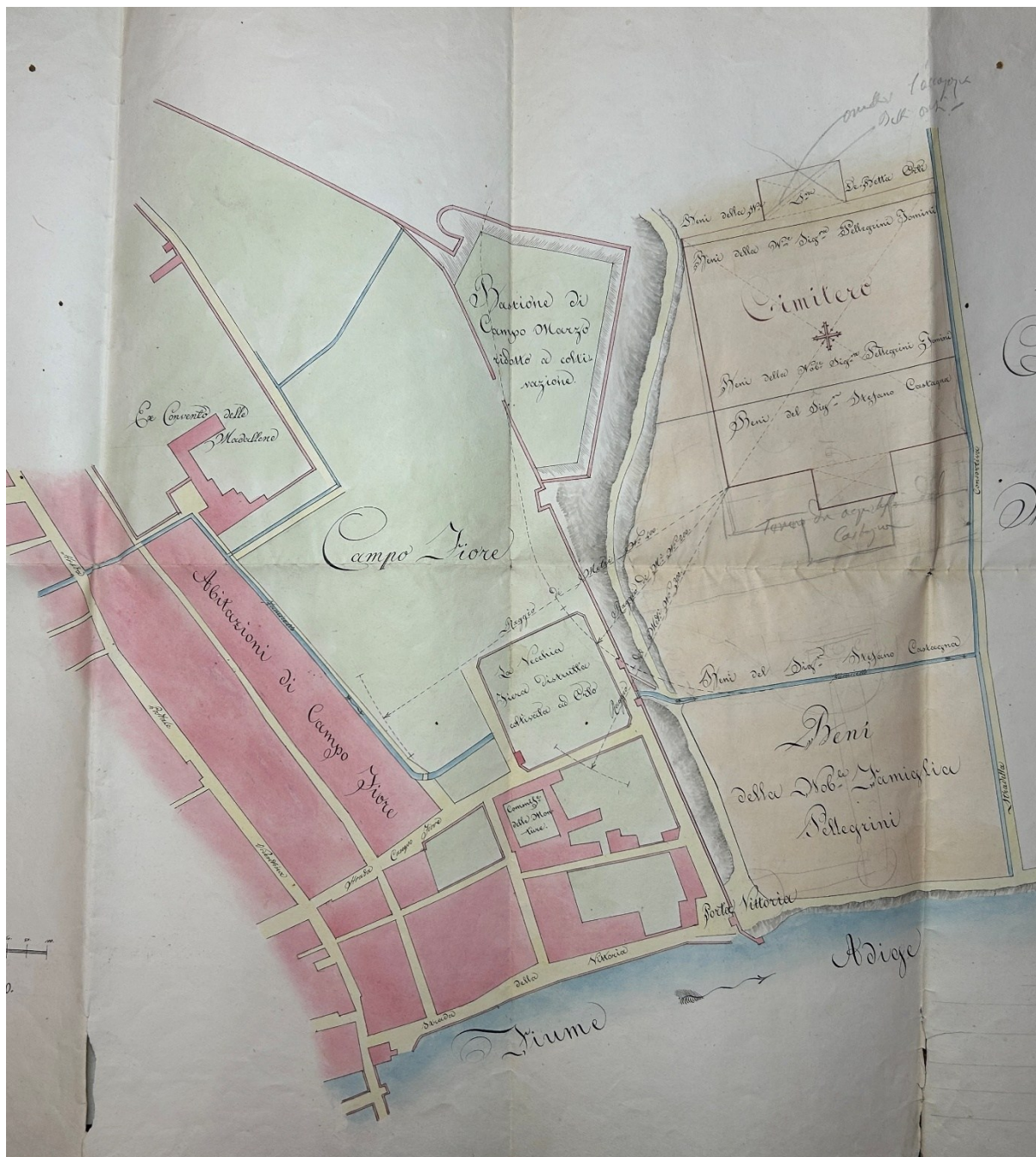
Figura 8. Progetto del cimitero prima delle modifiche. ASVr, I.R. Congregazione Municipale di Verona (1815-1866), Cimitero, b. 312.