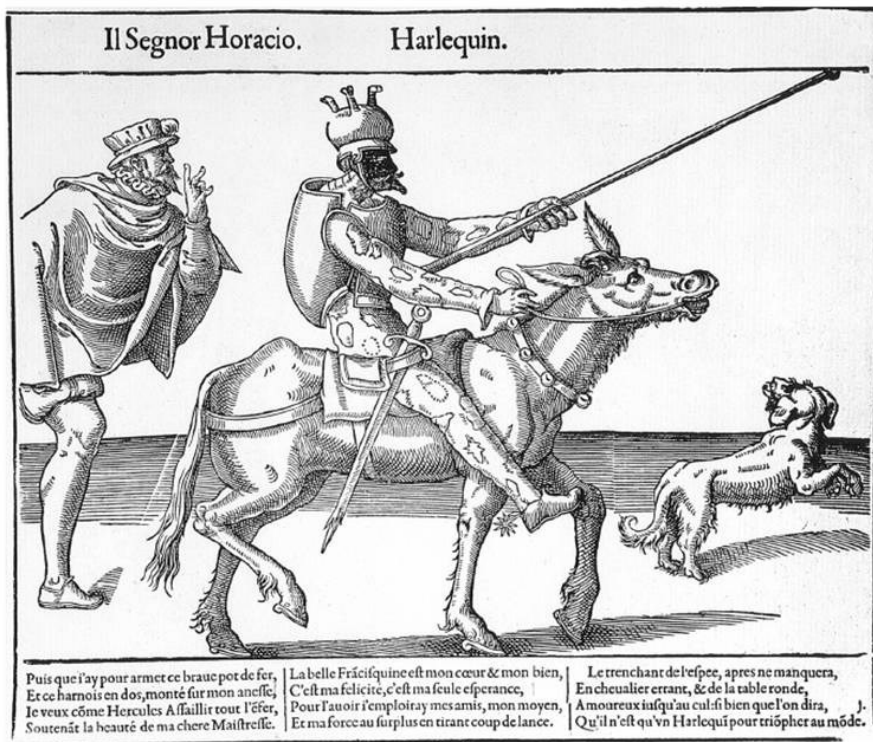
Recueil Fossard – Harlequin caballero errante